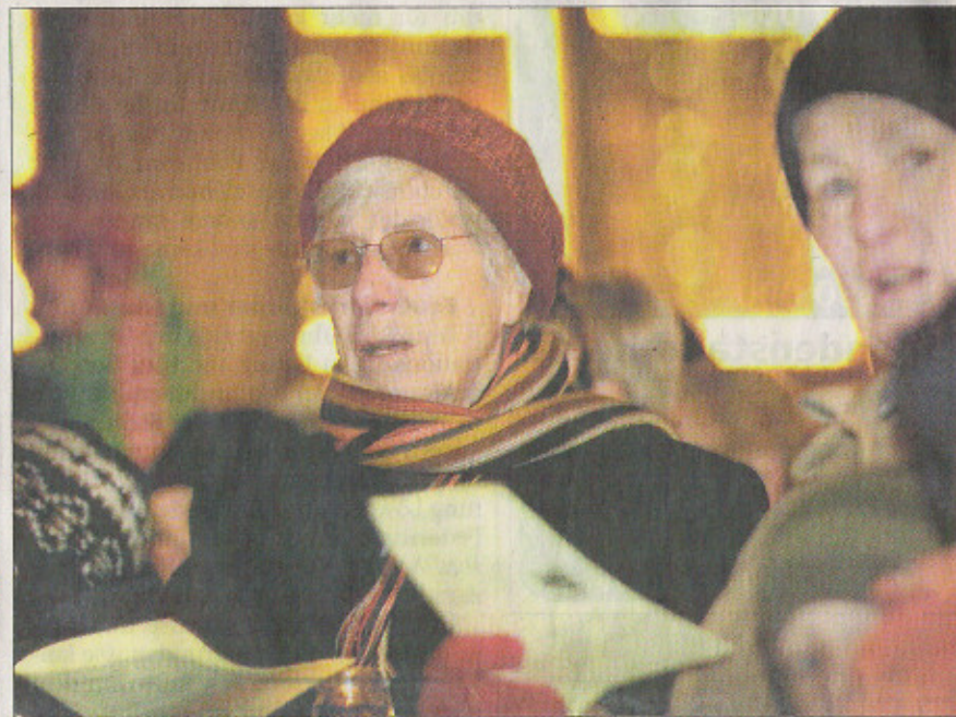
Impressionen vom Wochenende: Vor der Hofkirche brennen am späten Samstagnachmittag rund 4000 Kerzen (links), auf der Weggisgasse vor dem Manor herrscht am Sonntagnachmittag reger Einkaufsbetrieb (oben rechts), und beim Kornmarkt werden am Sonntagabend Weihnachtslieder gesungen (unten rechts).